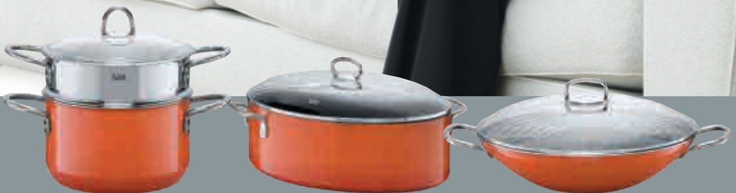
ausgereifte Technik so gut wi